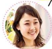
M.H.さん 33才 東京都

私は中学生の頃から家族で気のトレーニングを学んでいます。 習う前は、人の目が気になったり、思ったようにできない自分にイラだ ったりしていました。 でも、洗心術を受講して、他の受講生の悩みを聞いたり、自分の悩みを 話していくうちに、終わったらとても心がスッキリ！ いろいろ悩んでたことが、ウソみたいになくなり、幸せな満たされた気 分になりました。友人関係やあれこれ悩んでいたことを、一人で抱え込 まなく済み、心が軽いと元気になるということを体感しています。