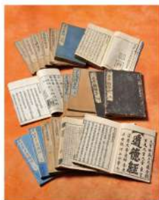
老子道德経（日本道観所蔵）

TAOとは、「道」を表す言葉で 中国の紀元前4世紀ころに 書かれたと言われる 『老子道德経』に説かれています。