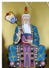
老子像（日本道観所蔵）